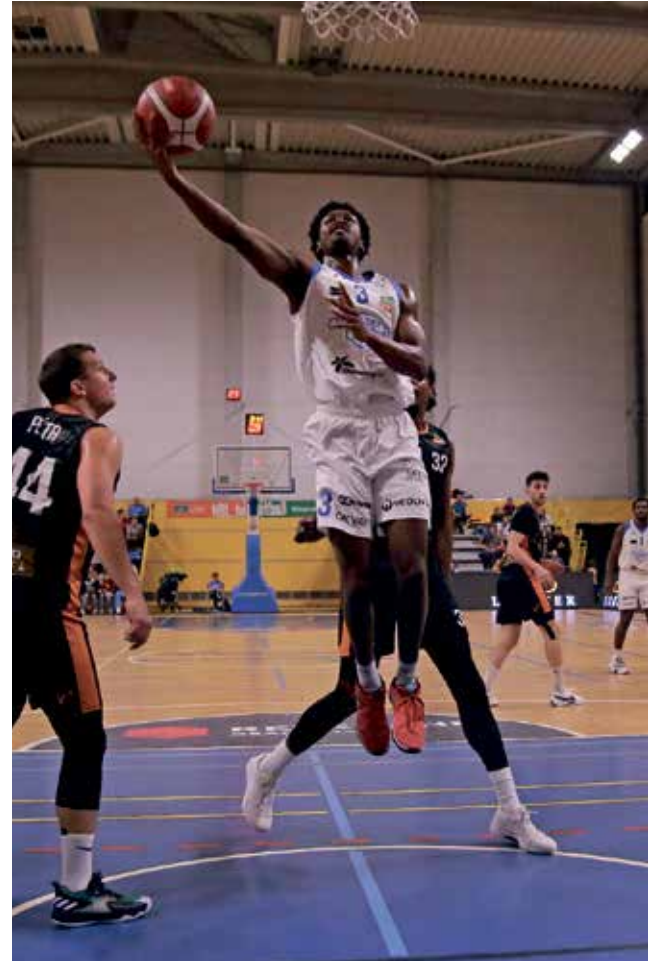
Basketbalisté BK Olomoucko zapsali druhou domácí výhru v řadě.

„V prvním poločase jsme hráli docela dobrý basketbal, až na to, že se nám nedařila hra jeden na jednoho. Dostali jsme přes padesát bodů a říkali si, že po přestávce začneme hrát týmově, což se dařilo na začátku. Pak jsme od toho ustoupili, nabrali velké manko a právě v této pasáži se utkání zlomilo.“ Tomáš Valentýn, forward Hradce. ■