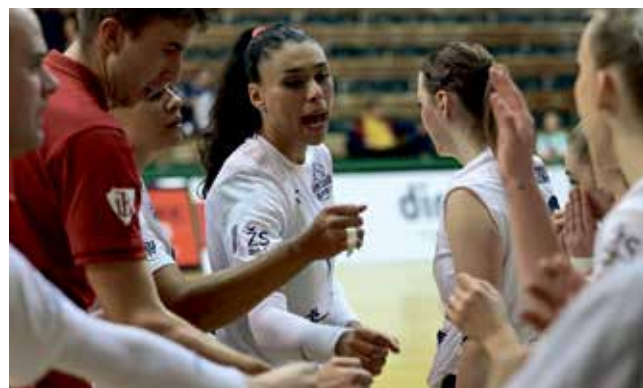
Volejbalistky VK Šantovka Olomouc se i přes první prohru v sezoně drží na čele tabulky.