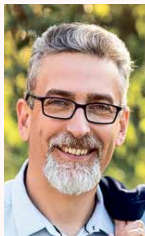
Mirek Žbánek primátor

Ptejte se vedení města Olomouce na e-mailové adrese otevrenaradnice@hanackyvecernik.cz a my Váš dotaz necháme zodpovědět!