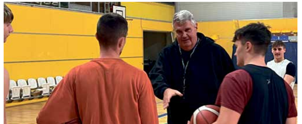
Legendární trenér Predrag Benáček trénuje na Haně.

Pětašedesátiletý basketbalový odborník je bývalým špičkovým basketbalistou. V dresu KK Bosna Sarajevo vyhrál evropský Pohár mistrů, předchůdce dnešní Euro