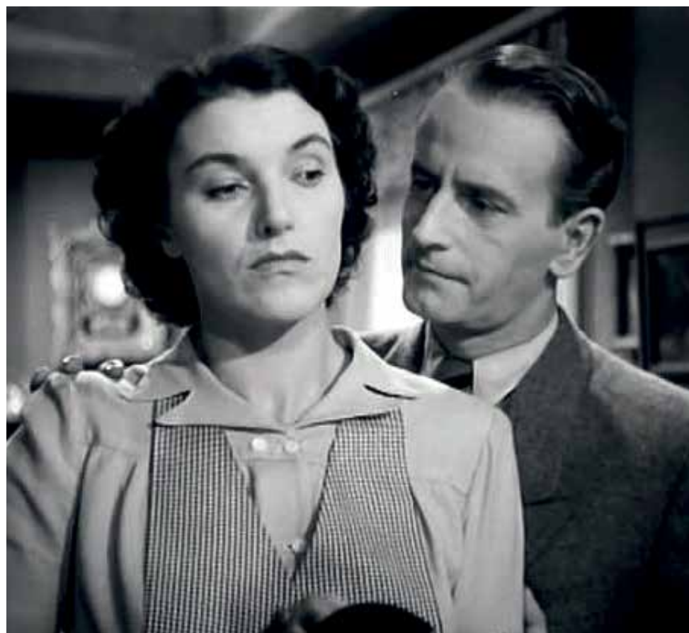
Marie Vášová v psychologickém dramatu Svědomí režiséra Jiřího Krejčíka (1948)