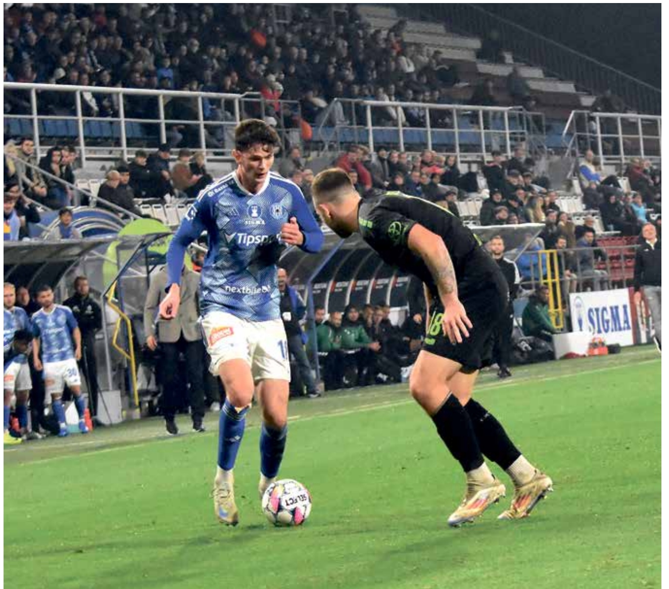
Fotbalisté SK Sigma Olomouc dohráli třetí domácí zápas v řadě v deseti.

„V první půli se hrál krásný fotbal. Měli jsme převahu a mrzí mě, že aspoň jedna ze šancí nekončila gólem, který by nám zajistil polštář do druhé půle. Je strašná škoda, že takto atraktivní duel pokazila červená karta. Je otázkou, do jaké míry se můžete vyhnout hráči, který vám skočí pod nohy. Jsem přesvědčen, že i v oslabení jsme mohli vyhrát, a s tím jsme do druhé půle šli,“ řekl trenér SK Sigma Tomáš Janotka. „Chtěli jsme pečlivě a důsledně bránit a tím vynahradit absenci jednoho hráče, který chyběl. Dalo se to zlomit a překloupat ke třem bodům. Zůstali jsme ve vysokém postavení, napadali jsme soupeře a znemožnili mu rozehrávku. Nakonec si cením bodu a také čistého konta, na které jsme dlouho čekali,“ podotkl. ■