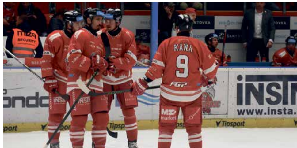
Hokejisté HC Olomouc jsou doma téměř stoprocentní, venku se jim zatím tolik nedaří.

V první třetině čekali diváci na branky marně. Ve druhé se hned po vzhazování dostali do přečíslení Plášek s Kohoutem, ale brankář Vomáčka předvedl skvělý zákrok. V čase 23:56 otevřel skóre pardubický Kousal. Na začátku 37. minuty Mora dokázala vyrovnat v přesilovce. Autorem branky byl Macuh. Ve třetí třetině nechtělo ani jedno mužstvo udělat chybu a inkasovat. Ve 47. minutě došlo k vyloučení Dynama, do šance se dostal Kunc, brankář Vomáčka kotouč vyrazil a ani dorážka Pláška v síti neskončila. V čase 51. minutě se Pardubice dostaly znovu do vedení. Paulovič poslal puk Vondráčkovi, který zakončil přesně. Hostům se již vyrovnat nepodařilo ani v šesti hráčích při závěrečné power-play. ■